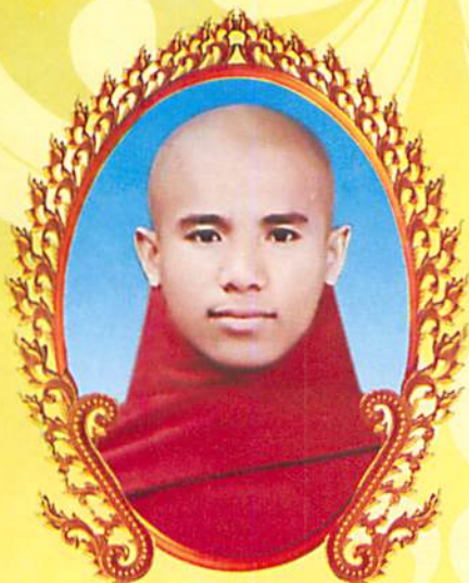
ရှင်သောဘိကာလင်္ကာရ (ပခုက္ကူ သာမဏေကျော်)