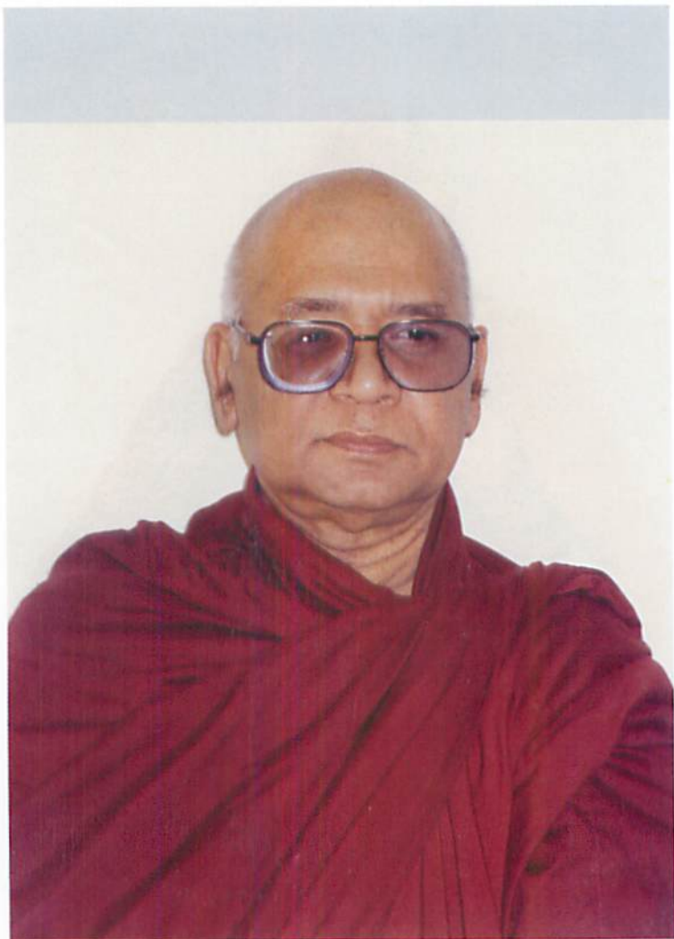
ဆန်းလွင် (ရှင်အာဒိစ္စရံသီ)