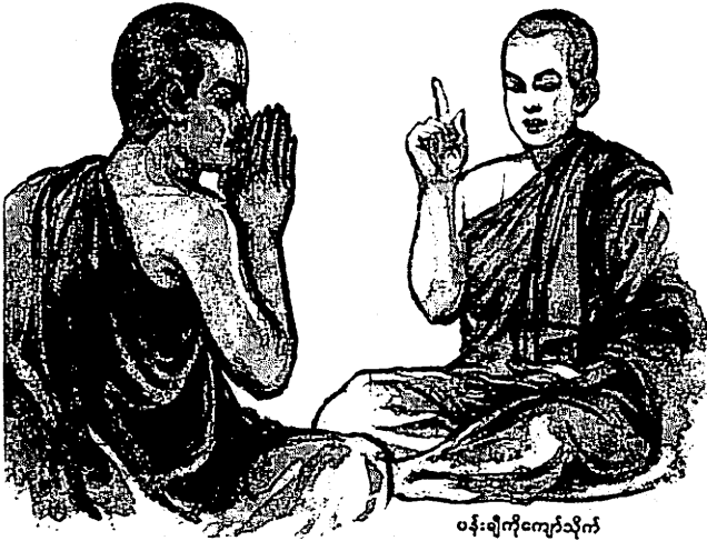
ဝန်းချိုကျော်သိုက်