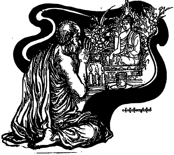
ဝန်းရီထိုလေးဦး