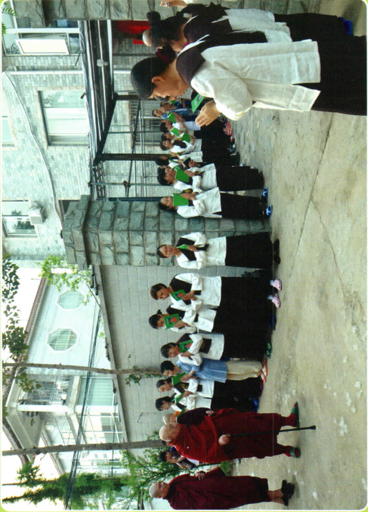
တရုတ်ပြည်၊ ချမ်းမြေ့မတ္တာတရားစခန်းသို့ ချမ်းမြေ့ဆရာတော်ကြွလာစဉ်