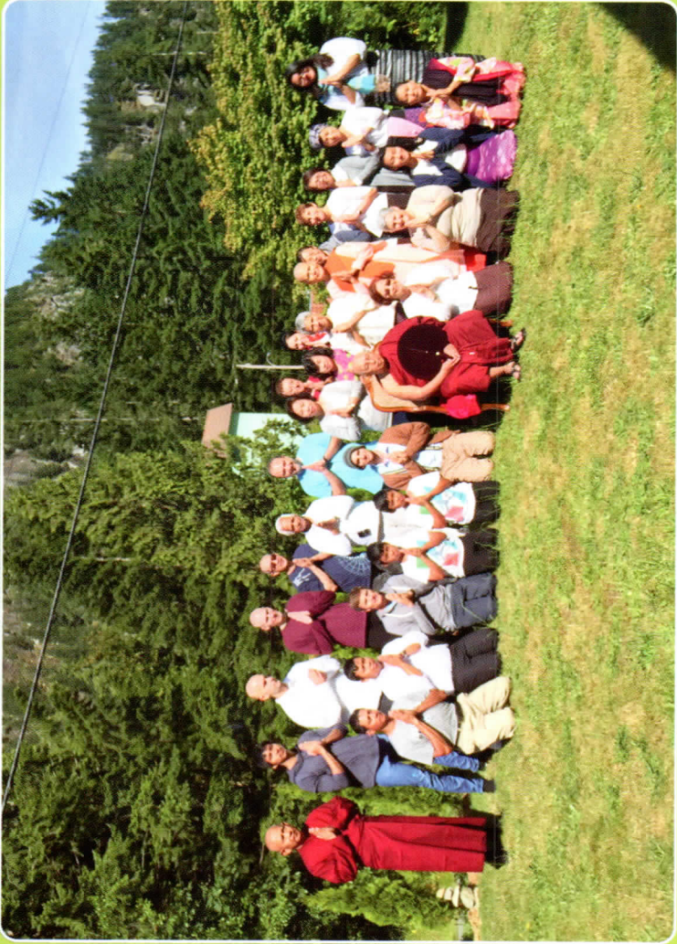
ကနေဒါနိုင်ငံ၊ ဗန်ကူးမားမြို့၊ တရားစခန်းအပြီး ယောဂီများနှင့်အတူ