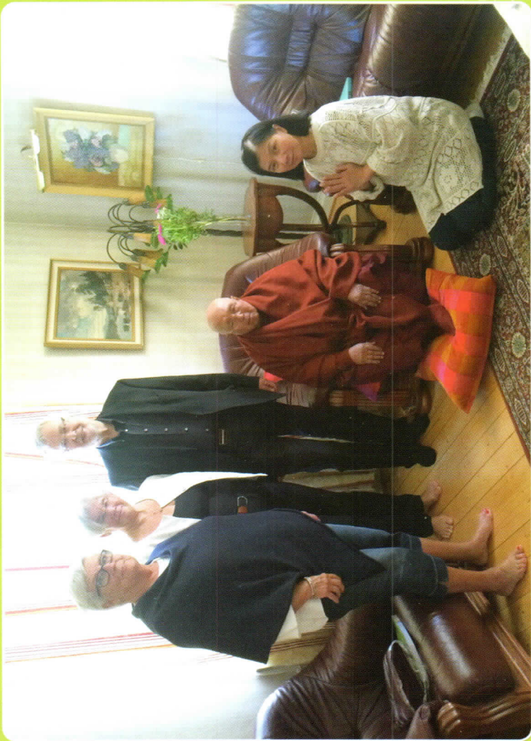
ဆွီဒင်နိုင်ငံ ဒကာဒကာမများနှင့် အတူ