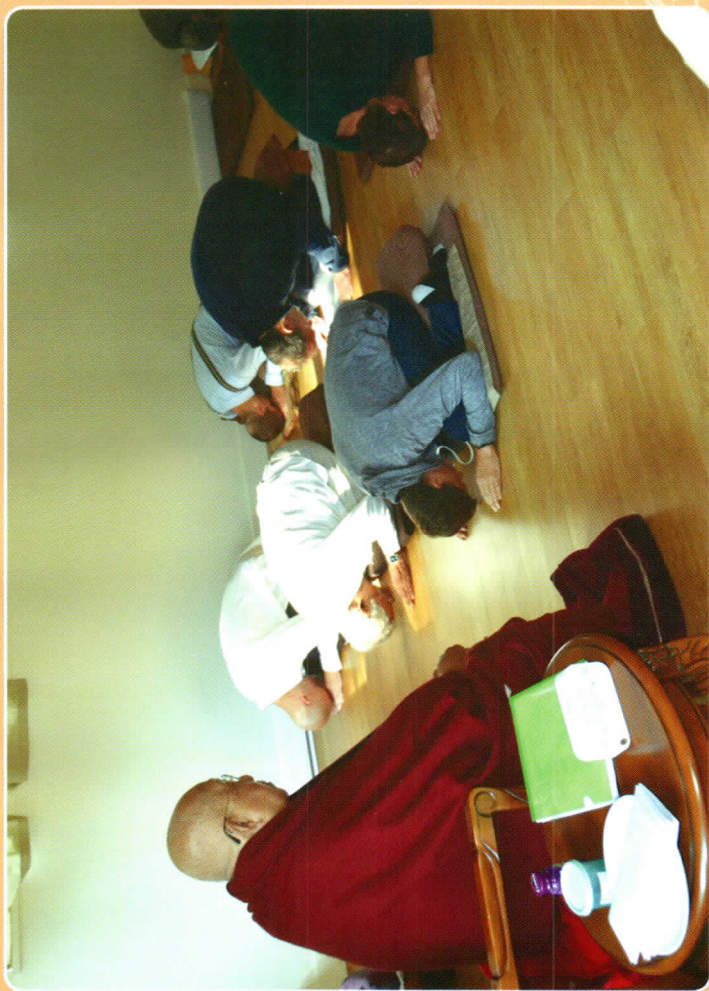
ကနေဒါနိုင်ငံ၌ ယောဂီများ တရားမလျှောက်မီ ကန်တော့နေကြစဉ်