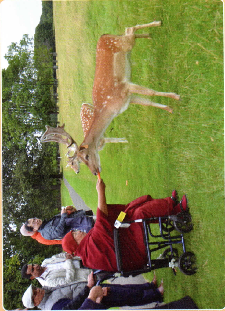
အိုင်ယာလန်နိုင်ငံ၊ မိဂဒါရန်တော