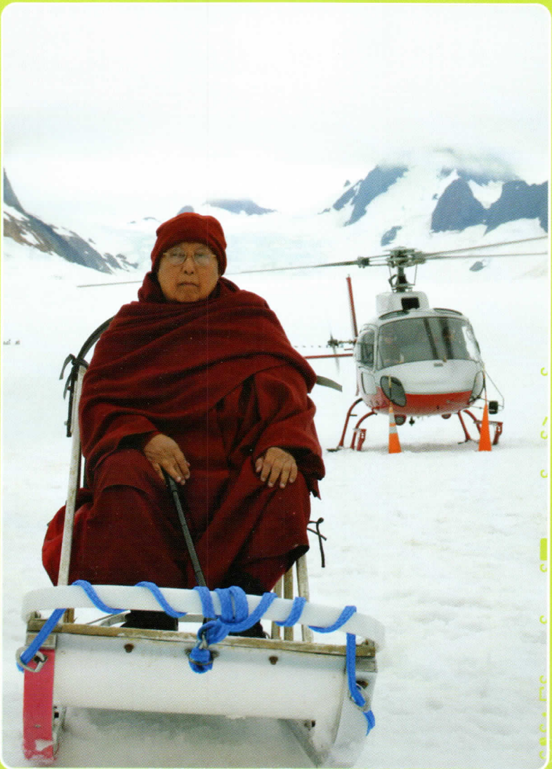
အလာစကာပြည်နယ်၊ ရေခဲမြင်ပေါ်တွင်