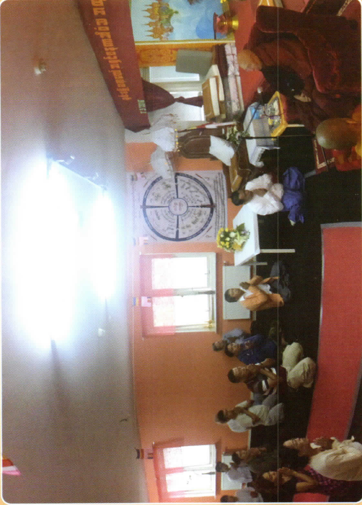
ဆွိဒင်နိုင်ငံရှိ မြန်မာပရိသတ်များ တရားနာနေစဉ်