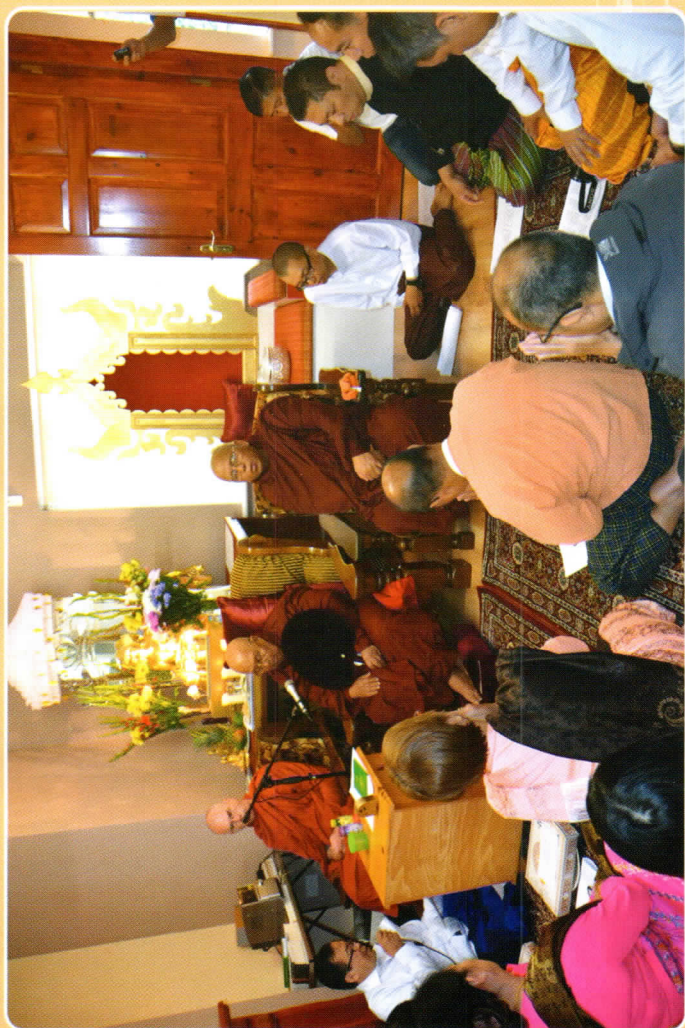
အိုင်ယာလန်နိုင်ငံ မြန်မာဘုန်းတော်ကြီးကျောင်း ဖွင့်ပွဲ