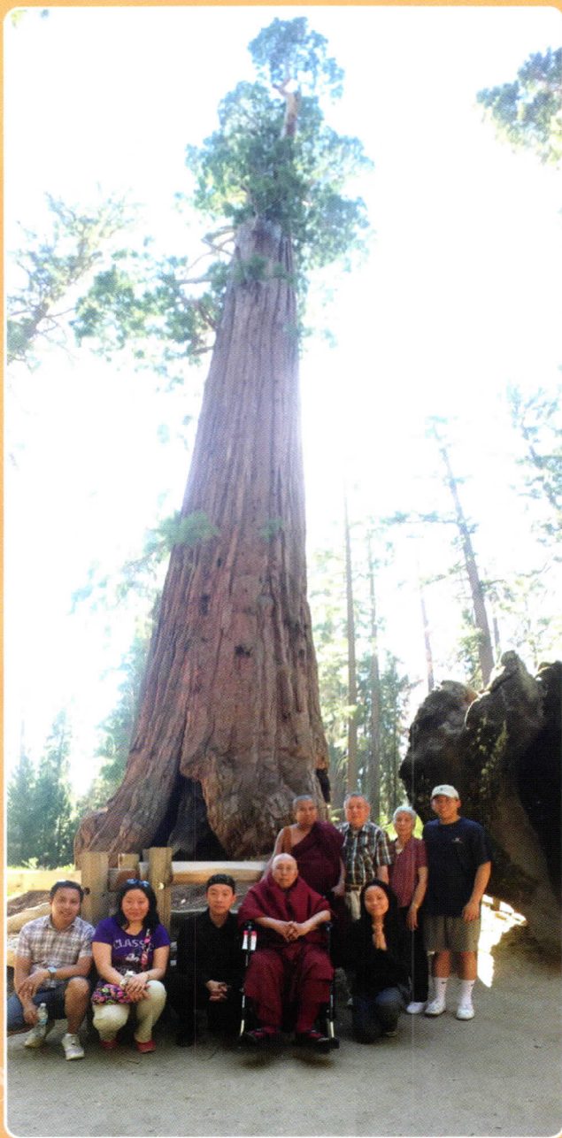
အမေရိကန်နိုင်ငံ၊ ကာလီဖိုးနီးယားပြည်နယ်၊ ဆီကျိုင်းယားတောရှိ လုံးပတ်အတုတ်ဆုံးသစ်ပင်ကြီး၏ ခြေရင်းတွင်