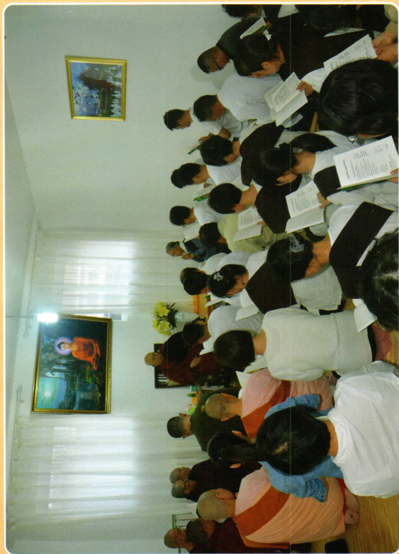
တရုတ်ပြည်၊ ချမ်းမြေ့မေတ္တာတရားစခန်း ယောဂီများ တရားနာနေစဉ်